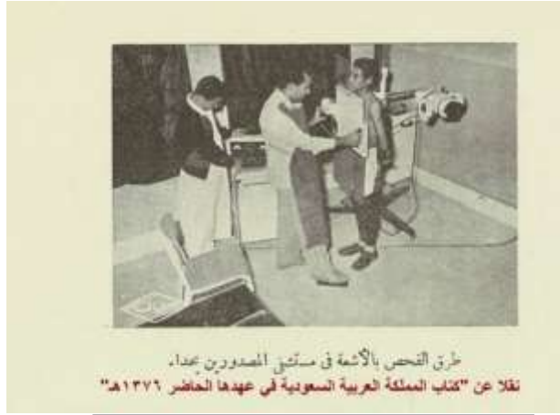
طرق التحصن بالأشعة في مستشفى الصدورين بجدة. نقلا عن "كتاب المملكة العربية السعودية في عهدها الحاضر ١٣٧٦هـ"