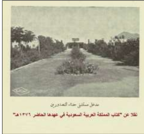
مدخل مستشفى حياة الصدورين نقلا عن "كتاب المملكة العربية السعودية في عهدها الحاضر ١٣٧٦هـ"